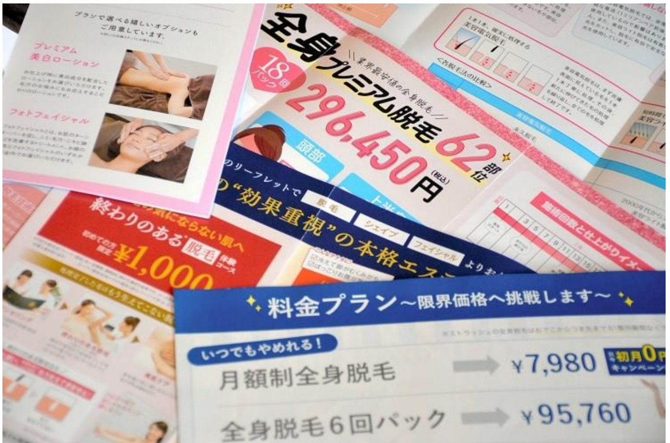
脱毛サロンのパンフレット。プランも値段も様々だ(記事に登場する店舗とは関係ありません)

中高年が脱毛を始める理由には、「介護脱毛」がある。将来受ける介護をみすえ、アンダーヘアの脱毛をするケースなどだ。